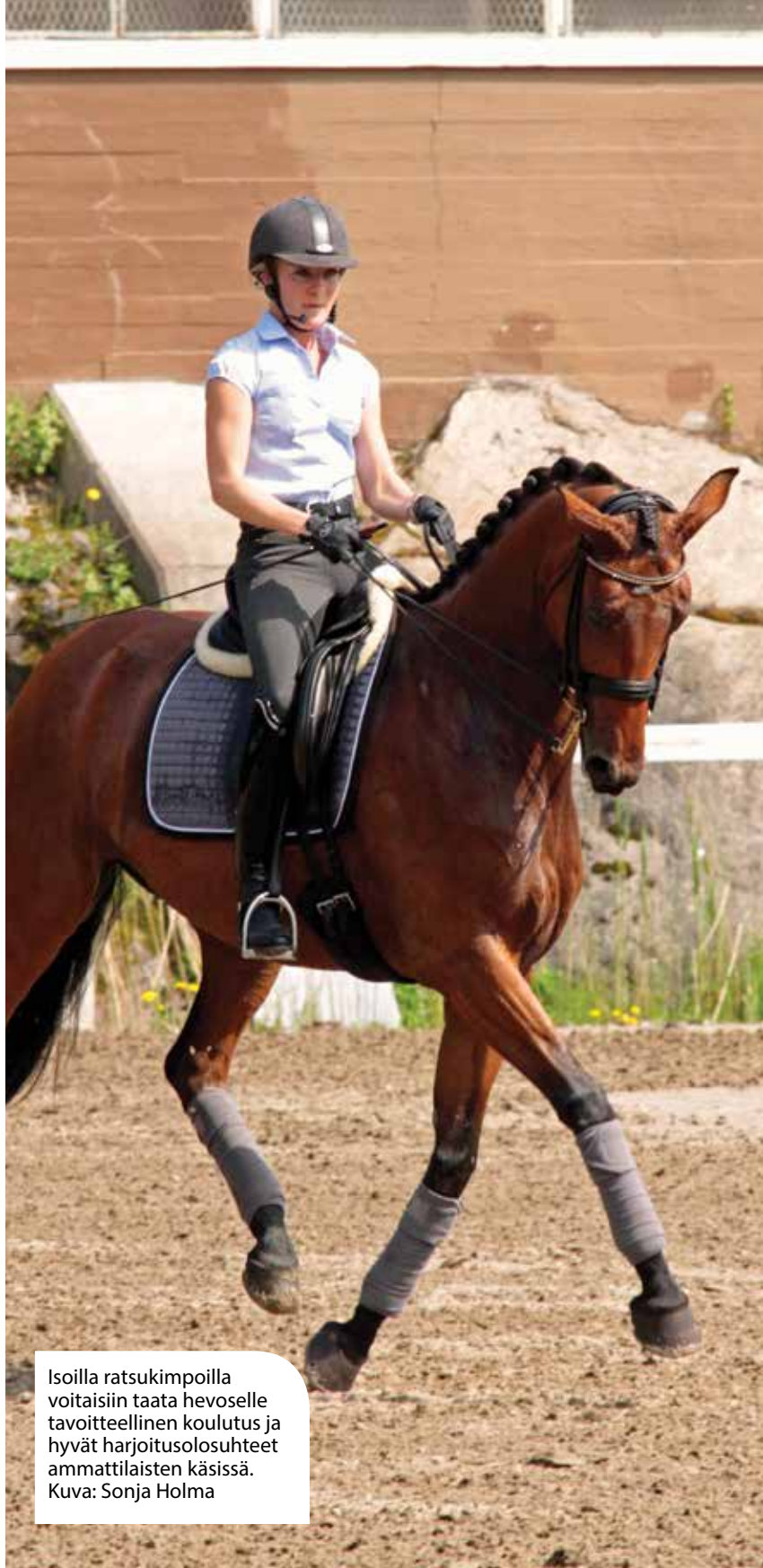
Isoilla ratsukimpoilla voitaisiin taata hevoselle tavoitteellinen koulutus ja hyvät harjoitusolosuhteet ammattilaisten käsissä.

Näistä pohdinnoista huolimatta kannustan ratsukasvattajia ja -ammattilaisia toteuttamaan omannäköisiä ja erilaisiakin kimppoja. Neuvoja saa varmasti myös ravihevosten kimpanvetäjiltä. Tervetuloa toteuttamaan ratsuhevosten kimppatalleja! Jään odottamaan myös todellista lajirajat ylittävää kimppaa, jossa suomenhevosen monipuolisuus pääsisi oikeuksiinsa – täällä on heti yksi osakas.