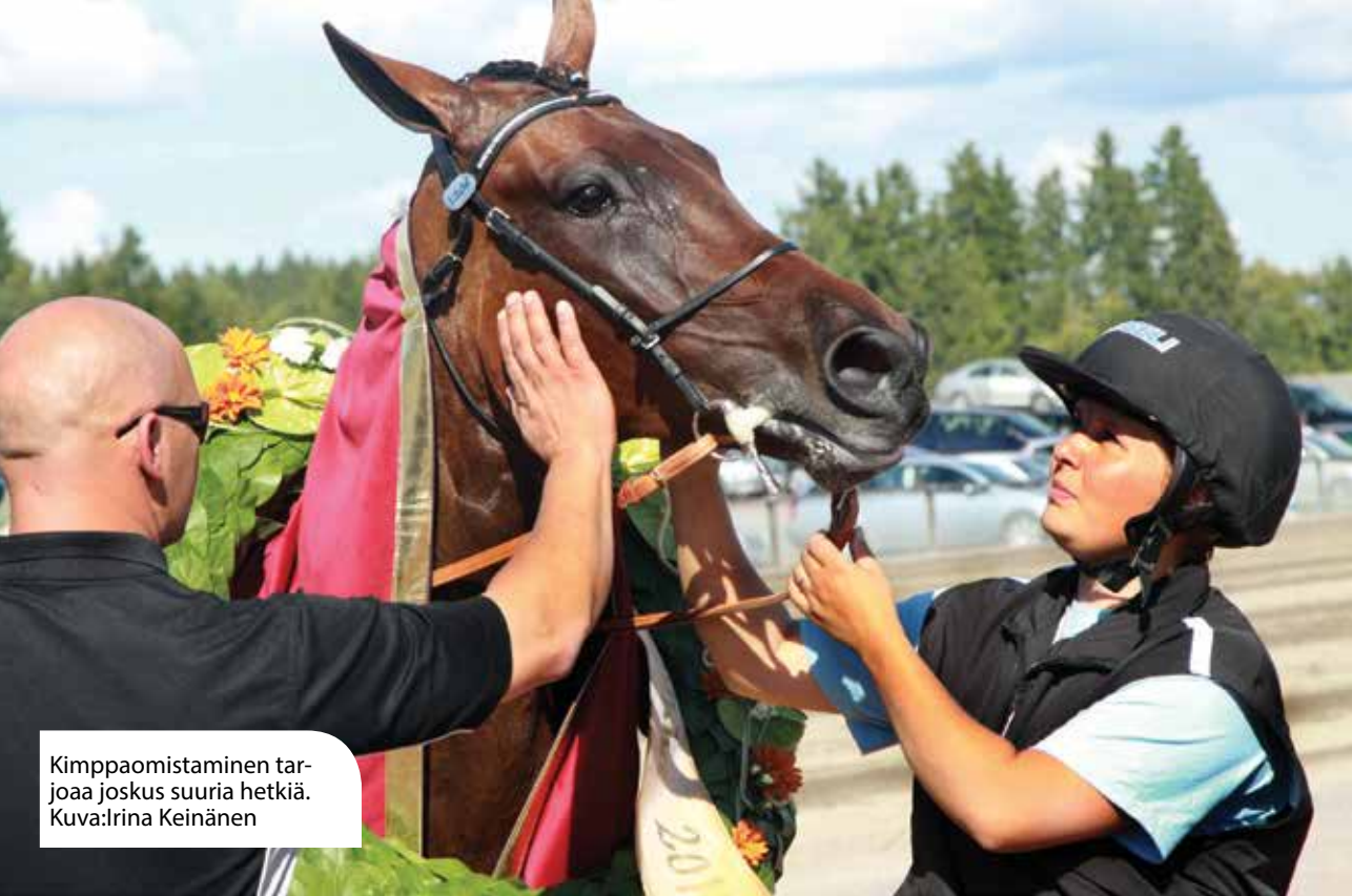
Kimppaomistaminen tarjoaa joskus suuria hetkiä.