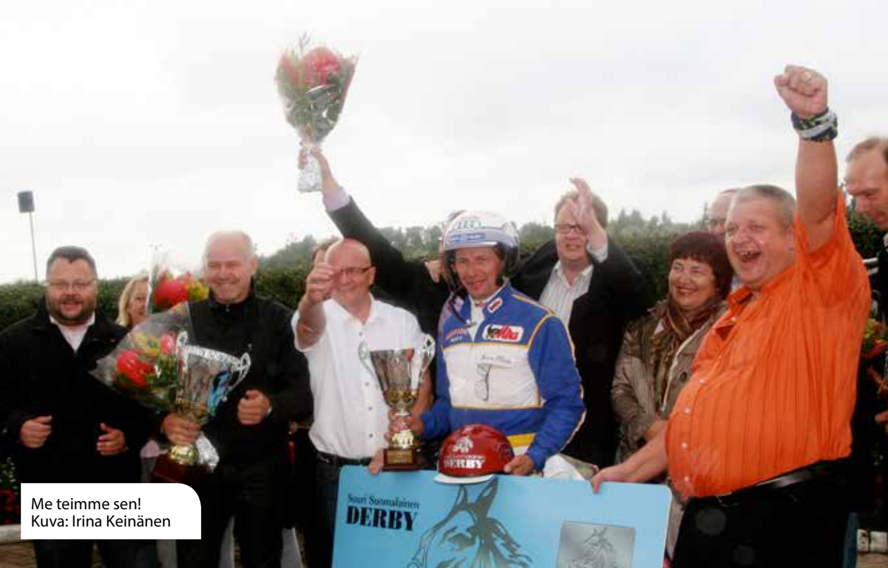
Me teimme sen!