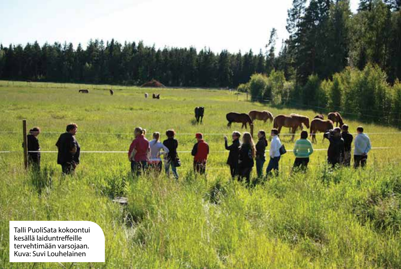
Talli PuoliSata kokoontui kesällä laiduntreffeille tervehtimään varsojaan.