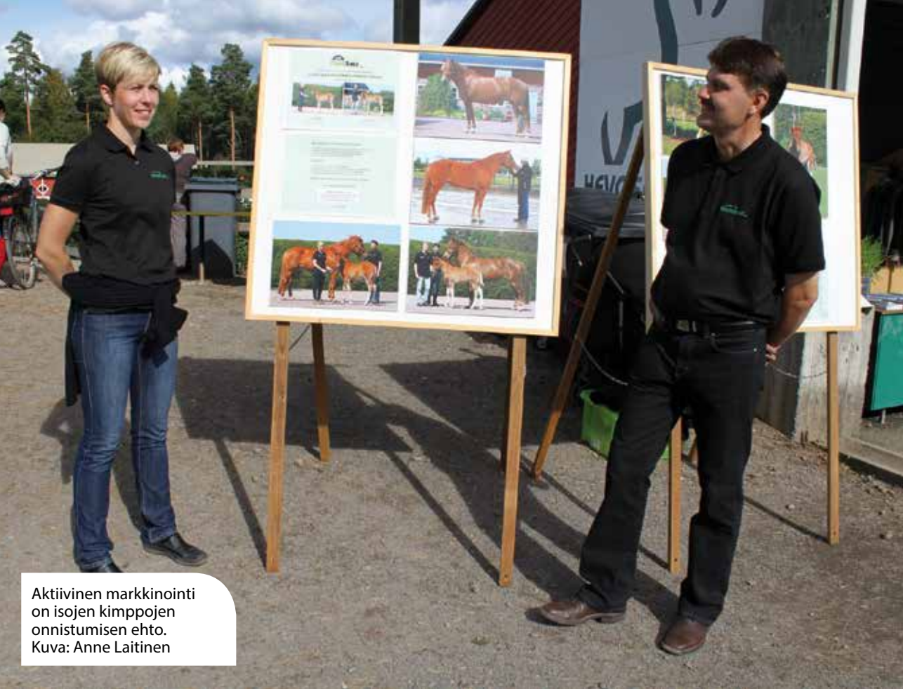
Aktiivinen markkinointi on isojen kimppojen onnistumisen ehto.